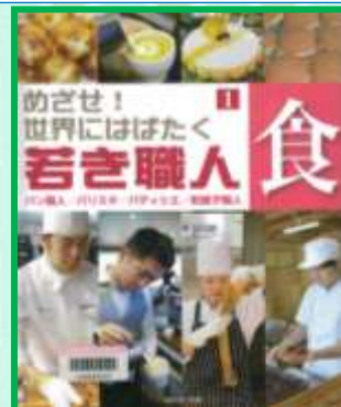
「めざせ！世界にはばたく若き職人1」 こどもくらぶ / 編 50×1

ものをつくる「職人」の世界に飛びこみ、目標を持って技術をみがく若い職人たちを紹介するシリーズ。1巻は、パン職人、バリスタ、パティシエ、和菓子職人が登場！！