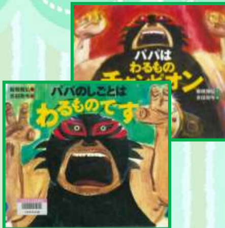
「パパのしごとはわるものです」 板橋 雅弘 / 作 Eパ

パパの仕事を探るべく、なんと悪者レスラーだった。正義の味方にやっつけられるパパなんて大嫌いだ。でも、試合が終わったパパは、ぼくをだっこして大切なことを話してくれて…。