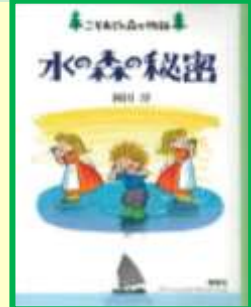
「水の森の秘密」 岡田 淳 / 作 91オ