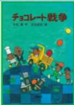
「チョコレート戦争」 大石 真 / 作 91オ

光一と明が、洋菓子店の前でチョコレートのお城を見ていると、とつぜんショーウィンドウがわれてしまいます。犯人あつかいされ、自分たちの言うことを信じてもらえない…一体どうなる！？