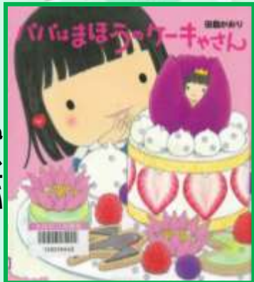
「パパはまほうのケーキやさん」 田島 かおり / 作 Eパ

ユイちゃんのパパは、ケーキやさん。ユイちゃんのお誕生日には、パパは朝から張りきって準備をして…。どんなケーキでも作れるパパって、かっこいい！