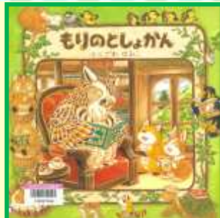
「もりのとしょかん」 ふくざわ ゆみこ / 作・絵 Eモ