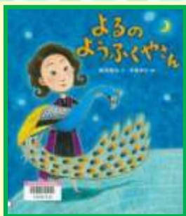
「よるのようふくやさん」 穂高 順也 / 文 Eヨ