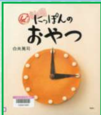
「にっぽんのおやつ」 白央 篤司 / 著 38ハ

静岡のうなぎパイ、愛知の鬼まんじゅう、大阪のたこ焼き、高知のぼうしパン、長崎のカステラ…。各地の人々の声をたよりに、47都道府県のおやつを写真とともに紹介！