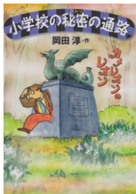
「小学校の秘密の通路」 岡田 淳／作 91オ

桜若葉小学校で何人かの子どもたちにふしぎなことが起こった。けれどその子たちは、ほかの人に話さなかったから、レオンの活躍はその子たちしか知らない…。不思議なトラブルを解決するカメレオン探偵のお話。