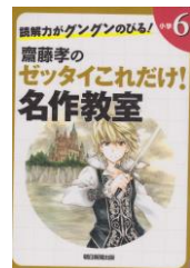
「斎藤孝のゼツタイこれだけ！名作教室 小学6年」 81サ

四万十川が流れる高知の町で、小学校最後の春をむかえた翔と正信。翔たちは、自分たちのことで焦りを感じる中、大人たちに刺激を受け、駅伝に挑むことに…。