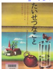
「たいせつなこと」 マーガレット・ワイス・ブラウン／作 Eタ

1949年にアメリカで出版されて以来よみつがれてきた名作。いせつなことはなにかを、やさしく語りかけます。