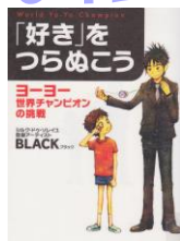
「好きをつらぬこう」 BLACK／作 77ブ

1949年にアメリカで出版されて以来よみつがれてきた名作。いせつなことはなにかを、やさしく語りかけます。