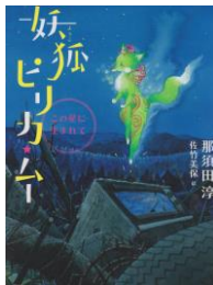
「妖狐ピリカムー」 那須田 淳／作 91ナ

人間をうらみながら妖狐に生まれ変わったピリカは、大妖怪になるためのテストを受けることに。課題は3つの願いとひきかえに人間のハートをぬすむことだった…。