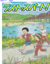
「ラストスパート」 横山 充男／作 91ヨ

ヨーヨー世界チャンピオンの著者。ごく平凡な、むしろ苦手なことやコンプレックスばかりだった著者が、素晴らしいタイトルを手にするまでの過程を描く。